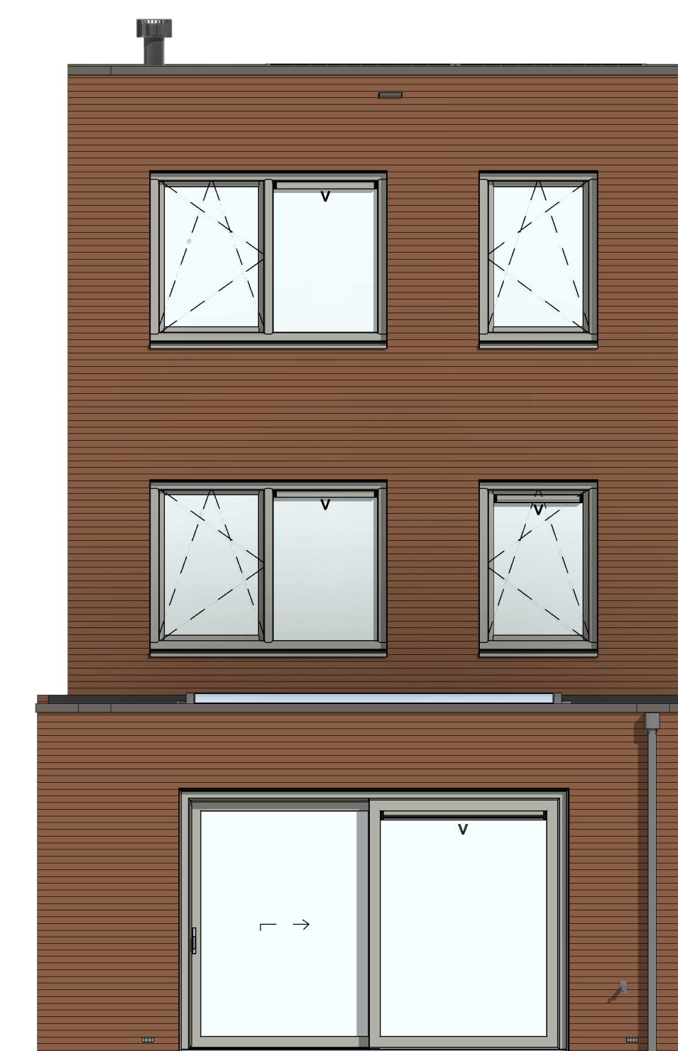
AG5001 - Achtergevel in basis uitvoering