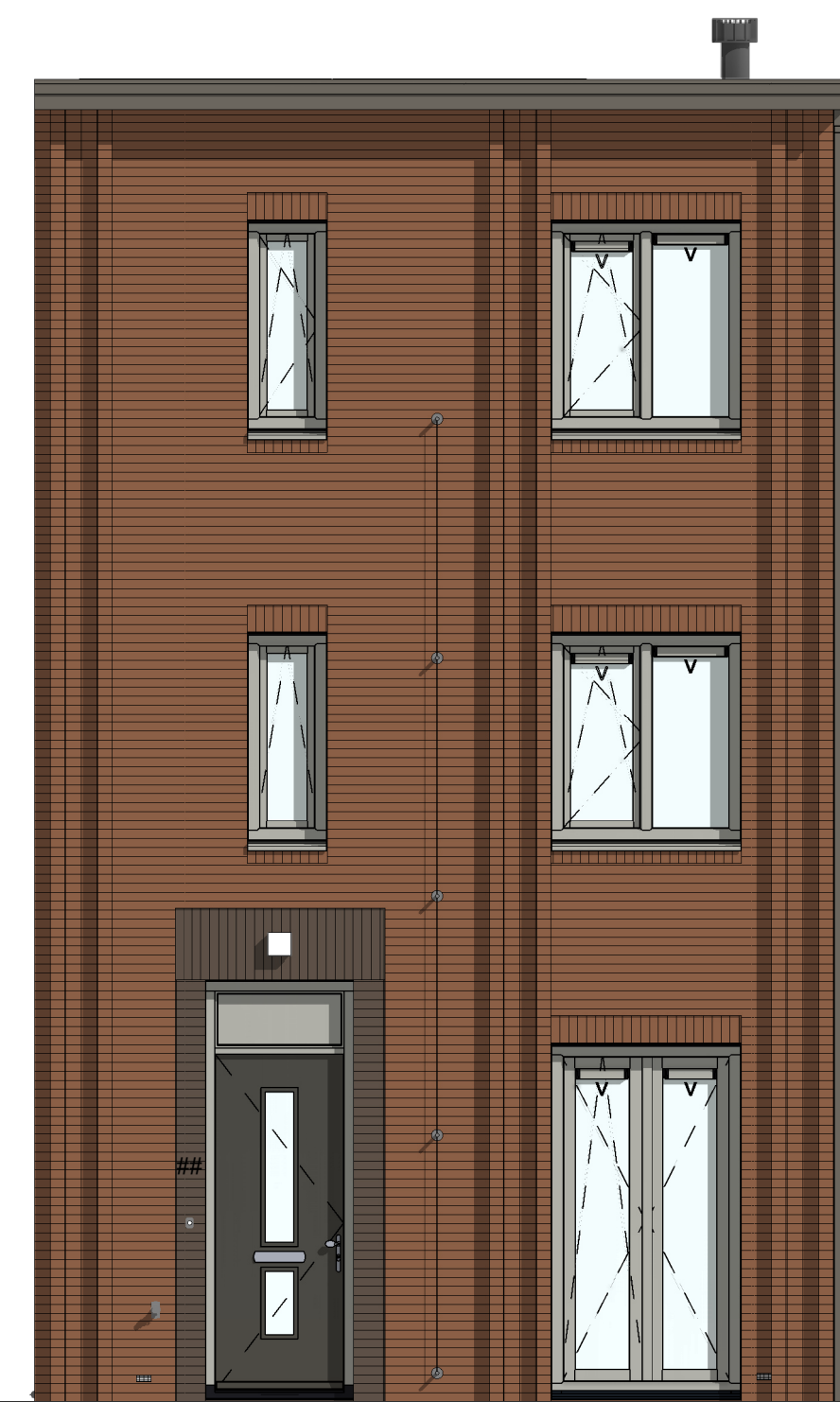
VG5001 - Voorgevel in basis uitvoering