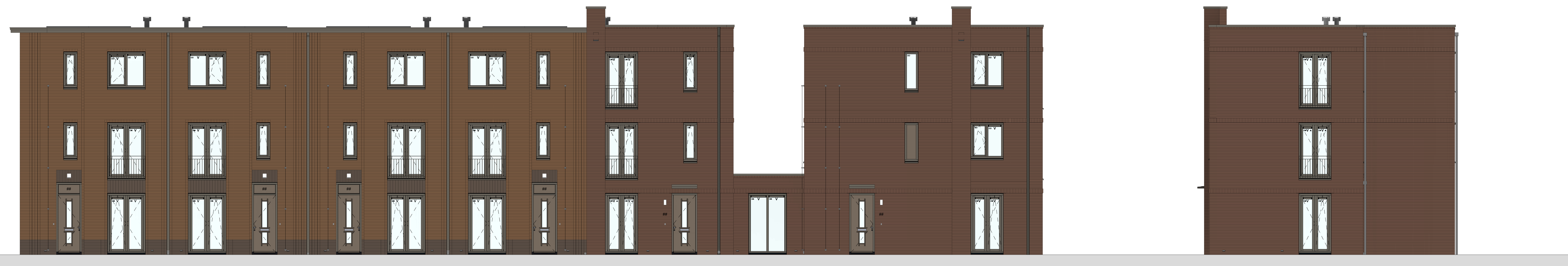
voorgevel 1 : 50