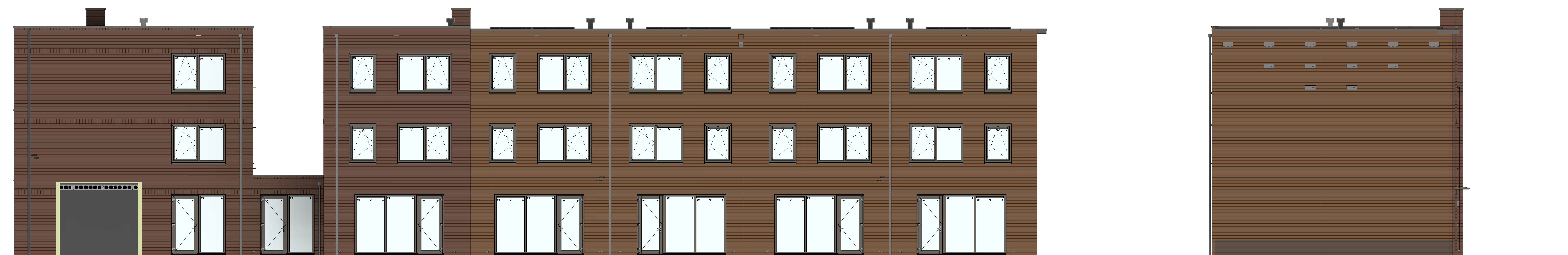
achtergevel 1 : 50